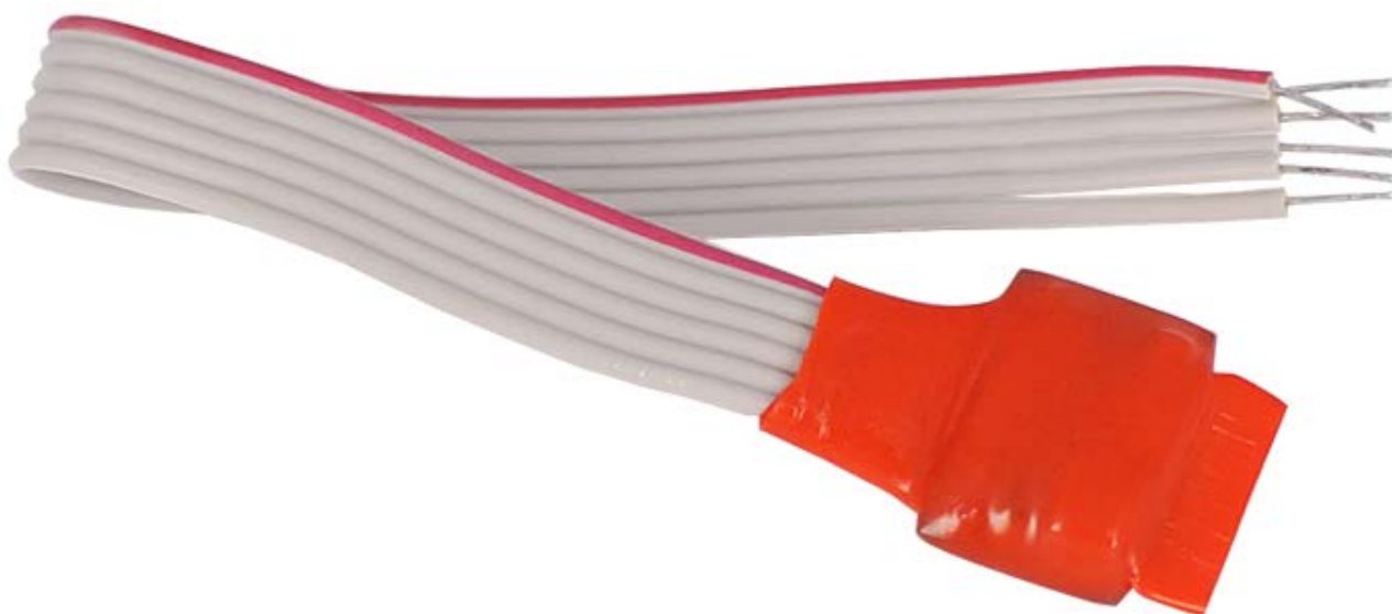
Рисунок 2.2.1 Внешний вид АР1

На рисунке 2.2.1 представлены внешний вид АР1.